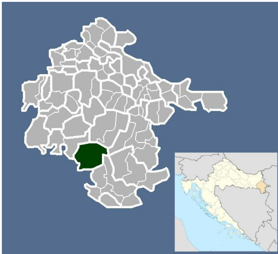
Slika 1.: Područje Općine Bošnjaci u Vukovarsko - srijemskoj županiji