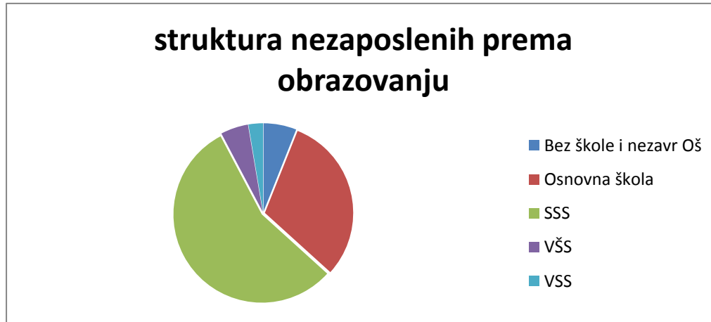
Grafikon br. 2.: Dobna struktura nezaposlenih prema obrazovanju u Općini Bošnjaci